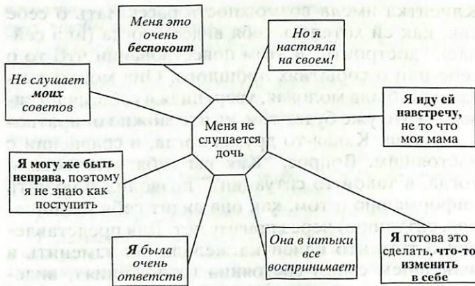
Рис. 2. Карта концептов клиента и первичный запрос клиента.

лее важным, на каком из уровней клиент предъ- являет информацию.