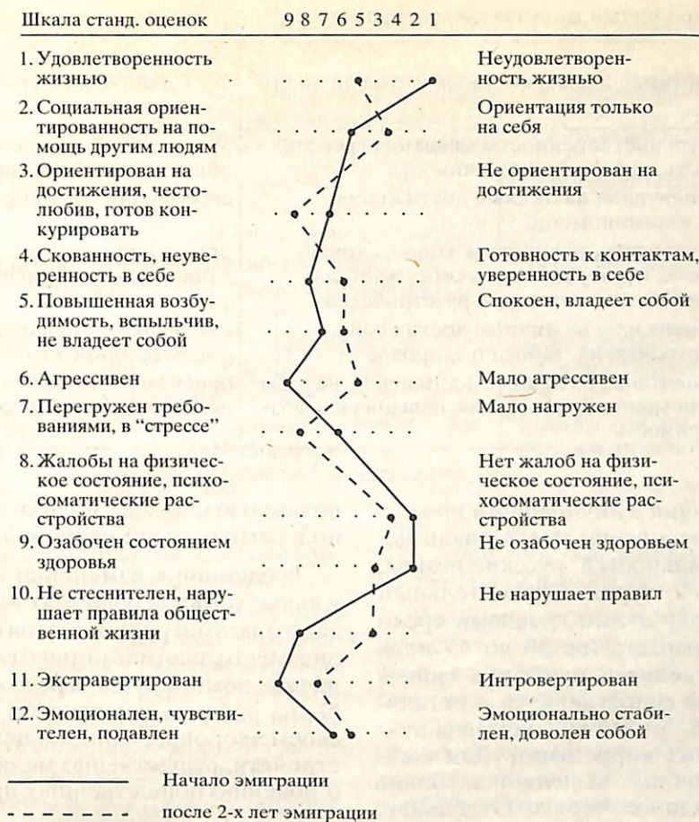
Рис. 1. Личностный профиль испытуемого.

денежное пособие. Оно выплачивалось при условии регулярного посещения интеграционных курсов (8 часов учебных занятий в день). В этот период испытуемым предлагался стандартизированный личностный опросник, отражающий особенности их личностного профиля.