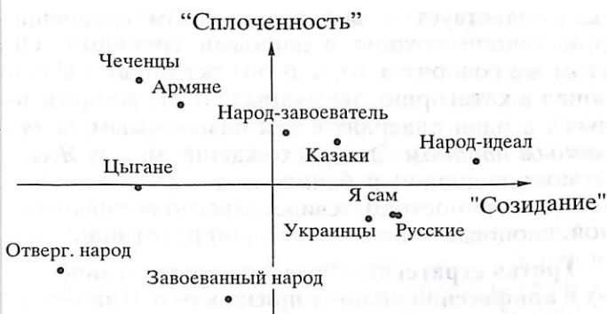
Рис. 1. Субъективное семантическое пространство межэтнического восприятия русских.