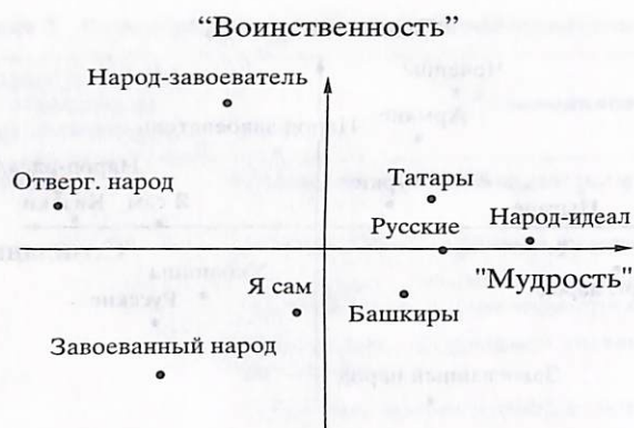
Рис. 3. Субъективное семантическое пространство межэтнического восприятия башкир.

пространство русских, только несколько отличается содержанием второго фактора: у русских это – “сплоченность”, а у казаков – “воинственность” (в него вошли с положительной нагрузкой шкалы: агрессивный и сплоченный), причем это – позитивная характеристика, ибо созидательные и воинственные в сознании казаков: Я сам, народ-идеал, народ-завоеватель, казаки . При этом русские и украинцы оцениваются как “созидательные”, но не “воинственные”, а чеченцы, армяне и турки – “воинственные”, но не “созидательные”.