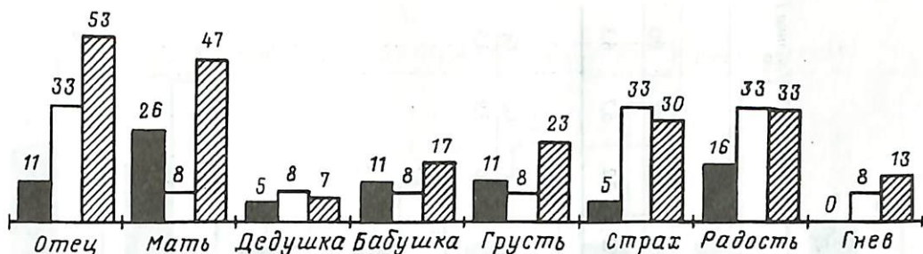
Рис. 2. Частота встречаемости (в %) признаков в МРВ. К1 – темный столбик, К2 – светлый, О – заштрихованный

s – исполнительность, терпеливость, устойчивость, стабильность, умеренность ("послушный, удовлетворенный, контролирующий себя...");