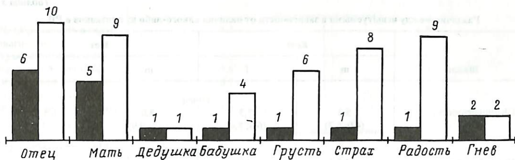
Рис. 3. Частота встречаемости (в абсолютных значениях) признаков в МРВ. Мужчины – темный столбик, женщины – светлый