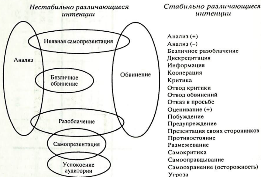
Рис. 1. Стабильно различаемые и "перепутывающиеся" интенции по материалам рассматриваемых текстов. Овалы (произвольной величины) – качественно различные интенции, их пересечение – возможность "перепутывания" данных интенций

характера отражена в отношении к оппонентам и противникам. Существуют также и категории "нейтральной" направленности ("третья сторона", "ситуация").